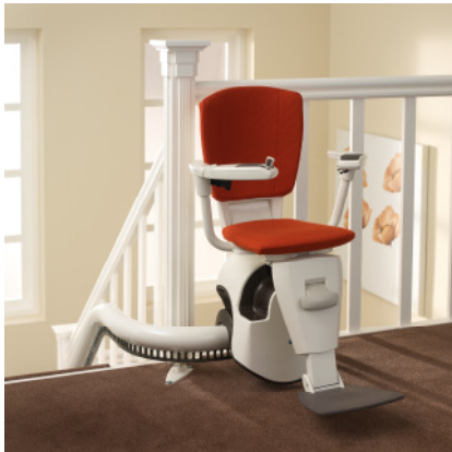
Der F 2 am oberen Start

Durch die praktische Klappfunktion kann der F2 überall platzsparend geparkt werden.